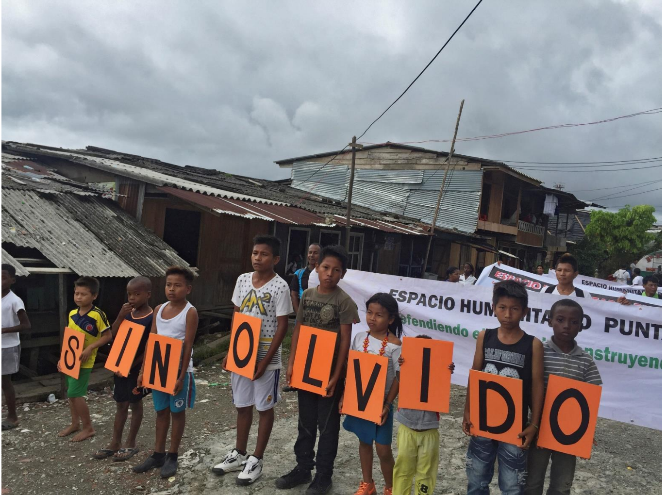
Arriba: Niños indígenas y afrodescendientes durante el acto que marcó la extensión del “espacio humanitario” de Buenaventura donde se incluía al puerto comunitario de Punta Icaico. La frase que forman, “Sin olvido”, hace referencia al historial de violaciones de los derechos humanos.

La desigualdad no es sólo cuestión de distribución de ingreso, sino primordialmente una cuestión de quién tiene el poder. El uso de los indicadores macroeconómicos para medir la desigualdad es deficiente, ya que no refleja esta realidad. Los abusos de poder han llevado a enormes escándalos por la corrupción en Brasil, Aun así, Honduras y Guatemala, desencadenando protestas generalizadas. Aun así, dichos actos no resultaron en reformas, sino reacciones de supresión y una reducción del espacio cívico. Esto muestra una clara advertencia sobre el creciente populismo o el creciente apoyo cada vez mayor a líderes con ideologías menos democráticos en América Latina y el Caribe. A menos que se lleven a cabo reformas, es probable que el electorado de la región no sólo vote por un humorista como Jimmy Morales (en Guatemala) o fuerce un aplazamiento del voto, como ocurrió en Haití, sino que vote por candidatos similares a Donald Trump en Estados Unidos o Rodrigo Duterte en las Filipinas, lo cual es más preocupante. Los hechos indican que la región tiene mucho trabajo pendiente por cumplir con el ODS 16: “Promover sociedades pacíficas e inclusivas para el