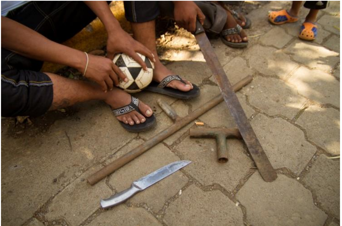
Abajo: Jóvenes mostrando sus armas caseras en una barriada de Managua.

Acabar con la violencia es un objetivo clave dentro de los ODS. 99 Por ejemplo, el Objetivo 5.2 busca “Eliminar todas las formas de violencia contra todas las mujeres y las niñas en los ámbitos público y privado, incluidas la trata y la explotación sexual y otros tipos de explotación.”