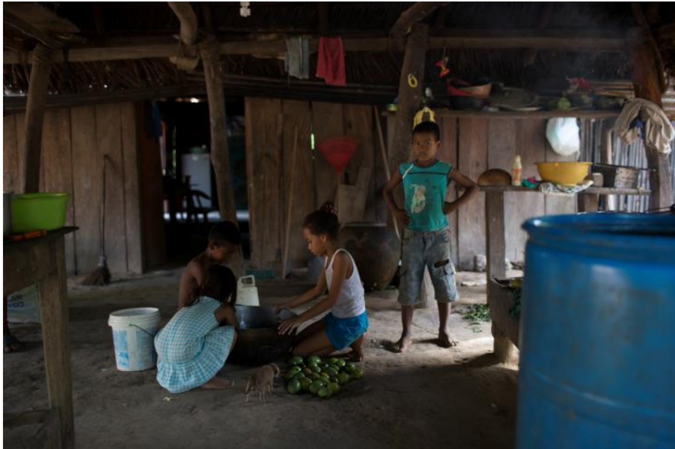
Arriba Típica casa familiar de Buenos Aires, Colombia. Contraparte de Christian Aid/InspirAction Corambiente examina a los niños y suministra medicamentos antiparasitarios y suplementos nutricionales.

En América Latina y el Caribe las oportunidades de crecimiento están muy ligadas a dónde se haya nacido y a la identidad, lo cual incluye el género, grupo étnico, raza, religión u orientación sexual. La desigualdad de ingresos es solamente un aspecto de la situación, ya que hay enormes brechas en el acceso a servicios esenciales (de salud y educación), seguridad social (pensiones y permisos de maternidad) y acceso al empleo o a mercados para vender lo producido. Las mujeres sufren desproporcionadamente los efectos de la pobreza, marginación, cambio climático, discriminación y violencia.