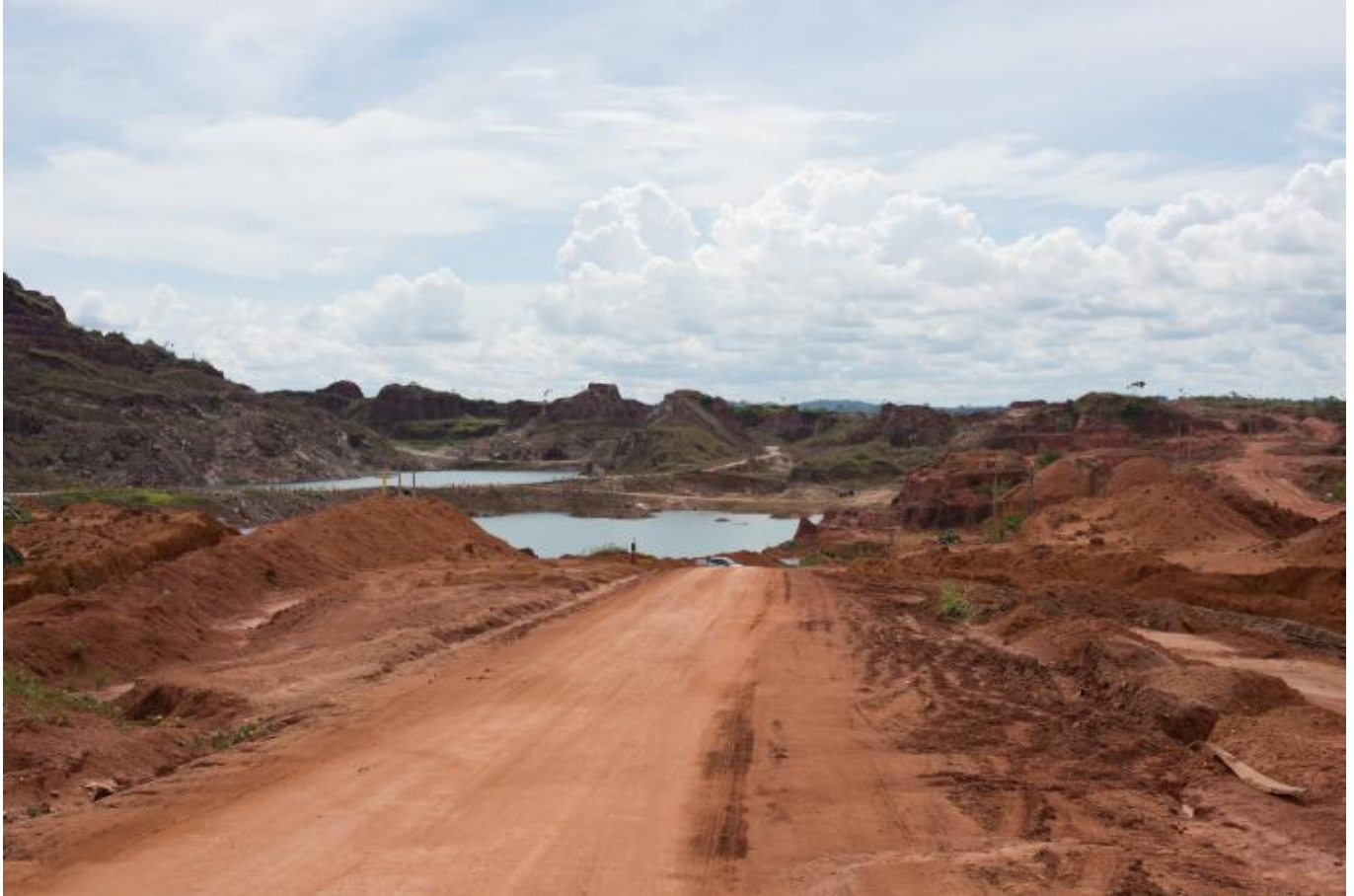
Arriba Yacimiento minero en Ariquemes, estado de Rondônia, Brasil. La minería, la ganadería extensiva y el cultivo de la soja han hecho que este estado sea uno de los lugares más deforestados del Amazonas, y ha causado tensión y conflictos entre los migrantes y las poblaciones indígenas.

El antiguo Secretario General de la ONU, Ban Ki Moon, entre otros, ha reconocido que el cambio climático es “la temática que define a nuestra época”. En su informe Progresos en los Objetivos de Desarrollo Sostenible afirma que “El cambio climático representa la mayor amenaza para el desarrollo y sus efectos generalizados y sin precedentes repercuten de forma desproporcionada en los más pobres y vulnerables. La adopción de medidas urgentes para combatir el cambio climático y reducir al mínimo las perturbaciones que provoca es esencial para poder implementar los Objetivos de Desarrollo Sostenible.” 169