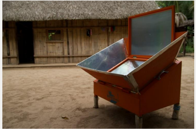
Arriba: Un horno solar facilitado por Soluciones Prácticas, contraparte de Christian Aid/InspiraAction, a una familia del proyecto piloto.

Una de las principales preocupaciones fue si las familias usarían las cocinas. Después de todo, preparar la comida de cierta manera durante tanto tiempo puede ser una costumbre difícil de cambiar. Los cuatro primeros meses fueron complicados para las mujeres que los usaban, ya que los métodos de cocción eran muy distintos, pero a lo largo de ese tiempo se adaptaron a la cocina solar.