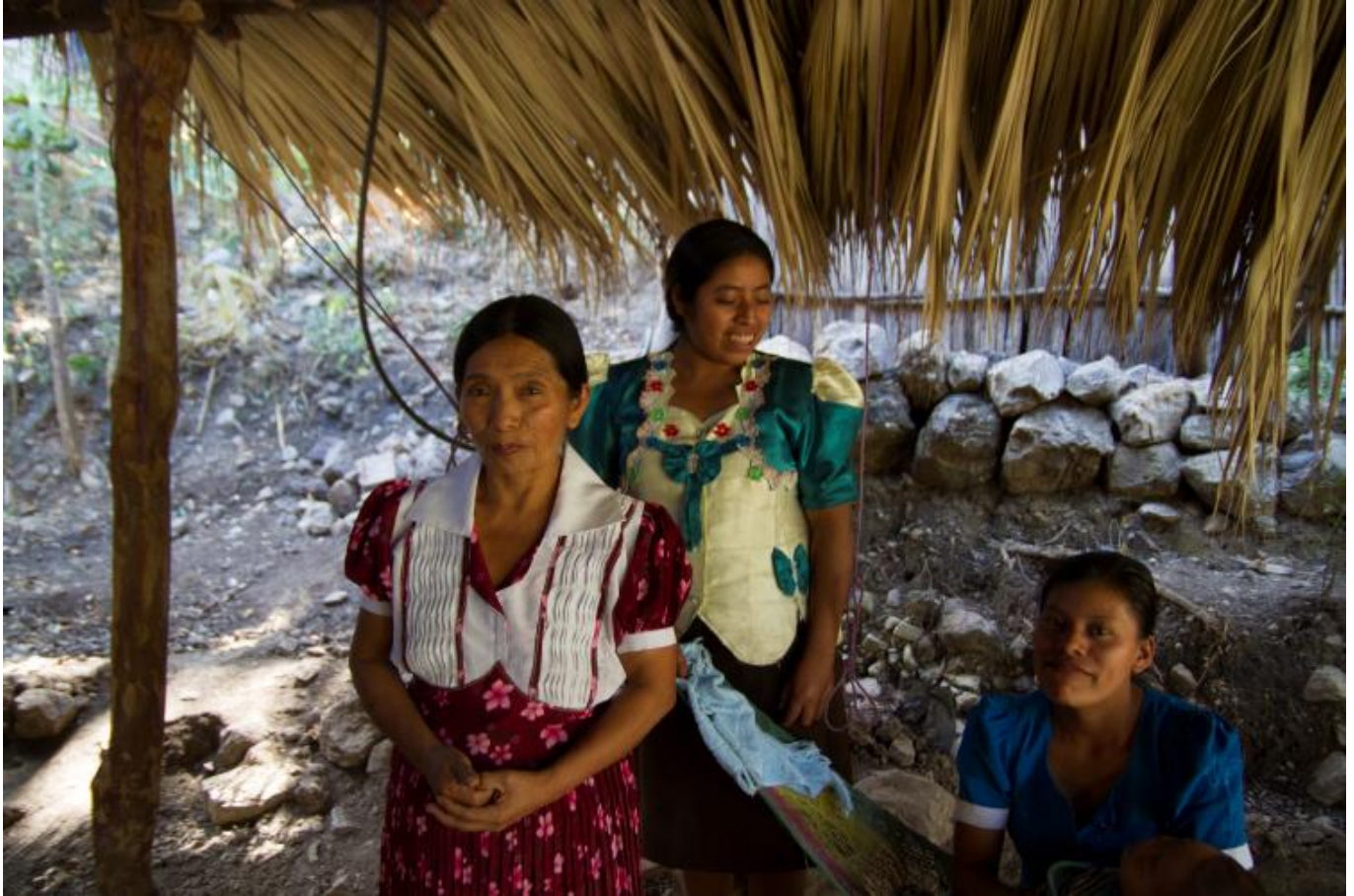
Arriba Miembros de las comunidades Ch'orti' de Guatemala

América Latina y el Caribe es una región étnica y culturalmente diversa. Hay al menos 44,8 millones de indígenas y 150 millones de afrodescendientes, 22 que representan el 30% de la población de la región. 23 Las mayores poblaciones indígenas se encuentran en México, Perú, Bolivia y Guatemala, 24 y en la región se hablan aproximadamente 420 idiomas indígenas. 25 En países latinoamericanos como Brasil, Venezuela y la República Dominicana más de la mitad de la población es negra. 26