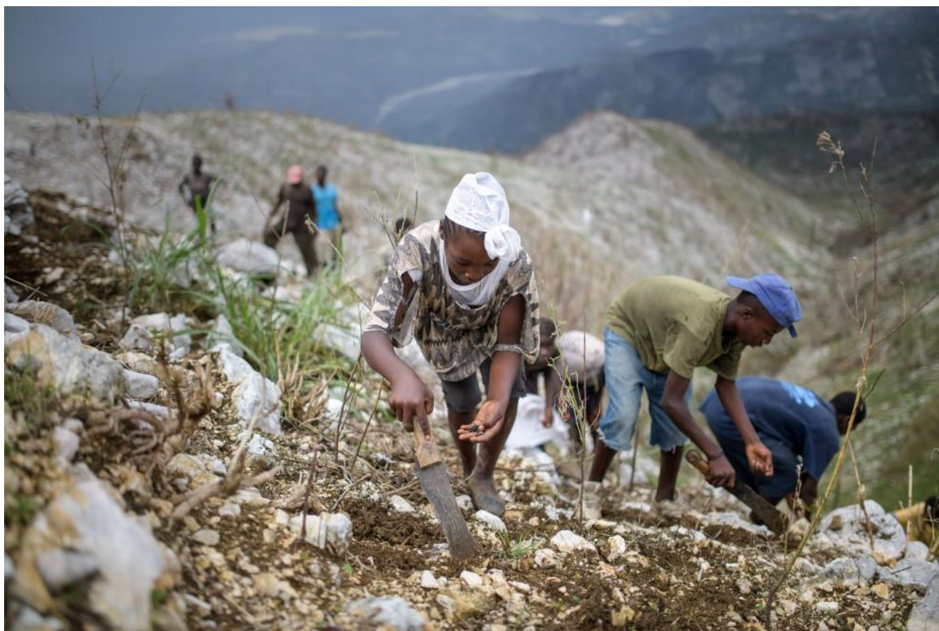
Arriba: Una familia planta semillas de judías en un alta ladera en el pueblo de Despagne, cerca de Jeremie, en Haití

Todo el mundo debería tener acceso en igualdad de condiciones al mercado laboral, tener acceso a un empleo seguro y de calidad y a una justa parte de los beneficios del crecimiento económico. El nexo entre el trabajo digno y el desarrollo se ha manifestado como una de las maneras más efectivas para asegurarse que los beneficios del desarrollo se compartan. 148