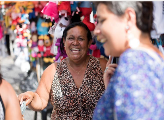
Arriba: Una de las vendedoras informales en São Paulo

En São Paulo el Centro Gaspar Garcia para los Derechos Humanos (CGGDH), contraparte de Christian Aid/InspiraAction, trabaja con algunas de las categorías de trabajadores informales más excluidos